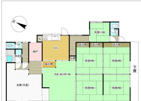
※現況と図面に相違がある場合、現況を優先します。